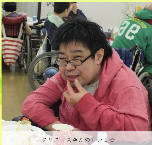
クリスマス会たのしいよ☆