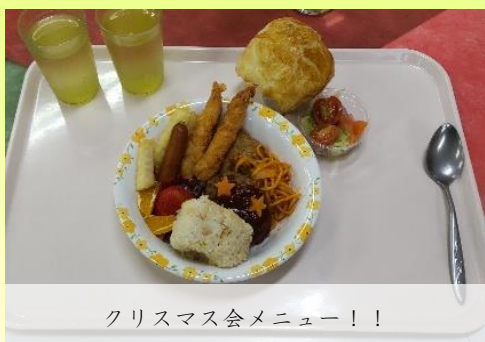
クリスマス会メニュー！！