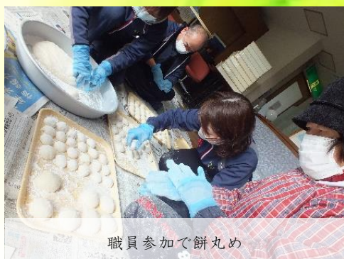
職員参加で餅丸め