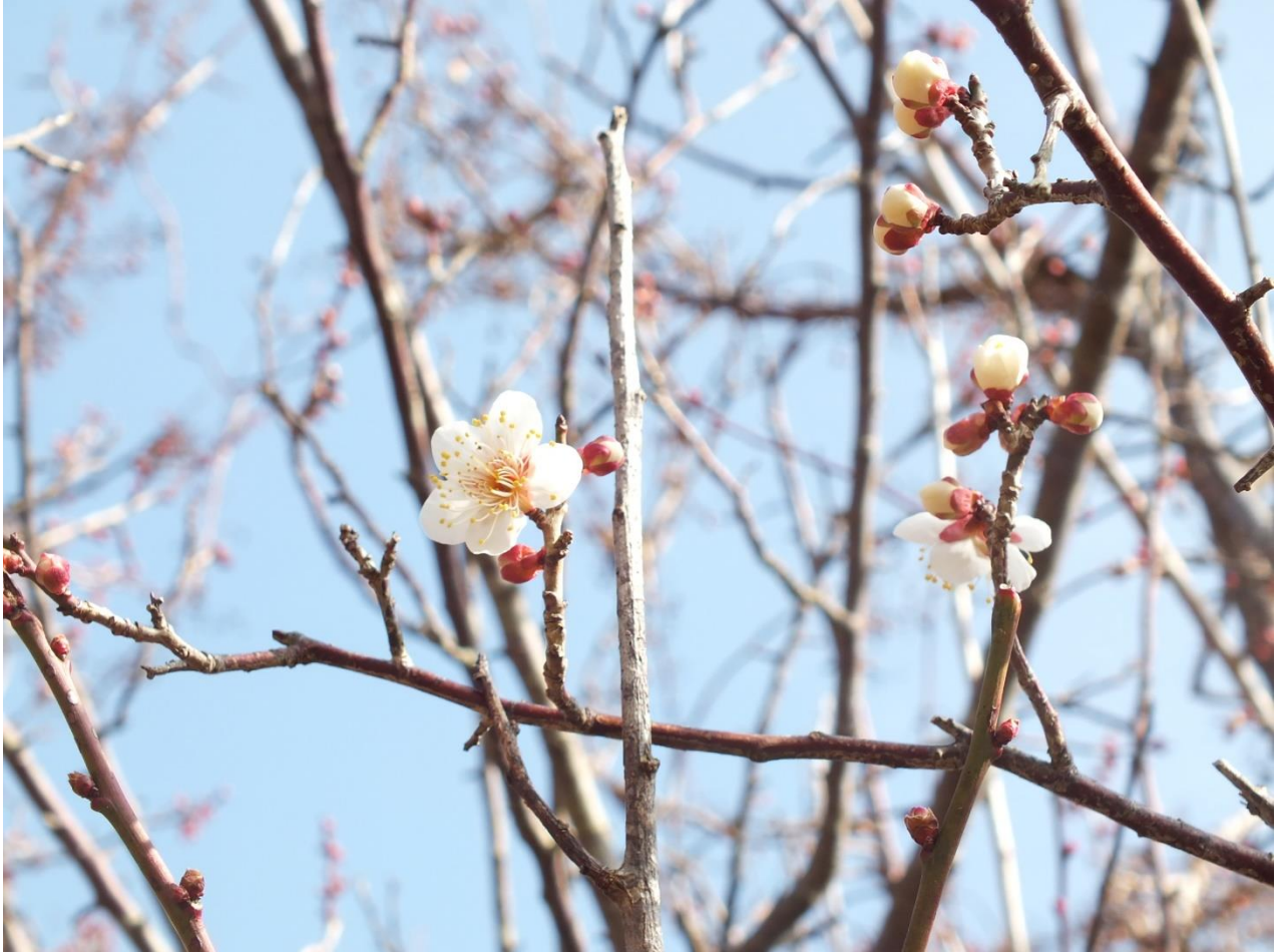
写真：敷地内の梅が咲きました