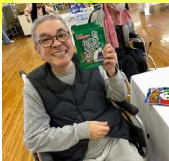
ビンゴの景品でゲット～☆

皆様におかれましては、ますますご健勝のこととお喜び申し上げます。 日頃より施設の運営に関しまして、ご理解とご協力をいただき、誠にありがとうございます。