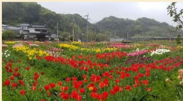
長崎市香焼町のチューリップ畑