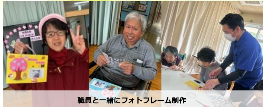
職員と一緒にフォトフレーム制作

三月三十日(土)に「さくら祭り」を開催しました。午前中は、製作レクとスポーツレクを行いました。製作レクでは毎年、施設に咲く桜を背景にした記念缶バッジ作りと、その場で写真の現像が出来るチェキを使用し、フォトフレーム作りを行いました。缶バッジ作りは少し難しい様でしたが、完成後は洋服やバッグ、車椅子に付けられている利用者様が多かったようです。フォトフレーム作りは、台紙を事前に準備をしていたので、利用者様には好きなシールを貼る作業をして頂きました。行事の中で、製作レクをしたのは初めてでしたが、皆さんの思い出に残ってくれると嬉しいです。