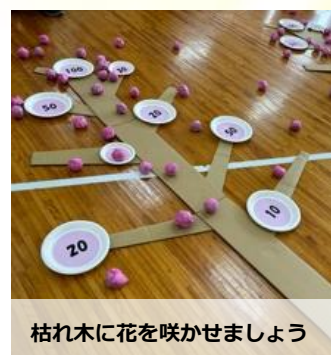
枯れ木に花を咲かせましょう