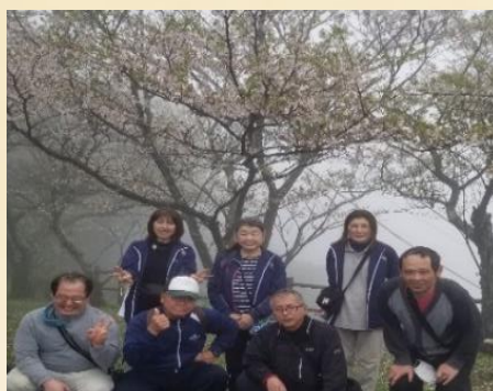
桜をバックに集合写真

鹿追の里では、四月三日、毎年恒例の野外活動で長崎市にある『野母町の権現山展望公園』と『香焼町のチューリップ畑』へ花見に行ってきました。