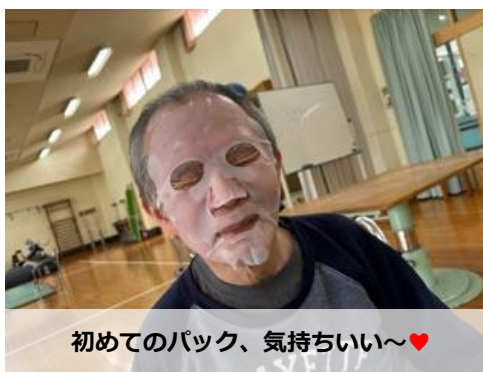
初めてのパック、気持ちいい〜♥

新緑が鮮やかな季節となりましたが、皆様いかがお過ごしでしょうか。作業療法で今年度予定している新メニューをご紹介します。まず、誕生月の方には美容パック体験をプレゼント。特別感が出る様に、普段しないような事が出来ないかな〜?と企画しました。肌の角質を取る「クレンジング」やお肌に合わせて「フェイスパック」等々、『今までこんなのにした事ない!』と男性・女性からも希望者続出中です。次にオセロや将棋等の文化系の大会の開催です。個人戦になるので、普段しているスポーツレクよりも熱い戦いになりそうな予感…。初代王者には黄金の駒を贈呈予定! (完全スタンプ手作りの金の駒をイメージしています)。次に園芸活動です。季節に合わせた花を種まきから行う予定なので、成長過程がとても楽しみです。随時、インスタグラムには投稿を行いますので、是非チェックしてみてください。