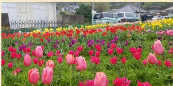
満開のチューリップ