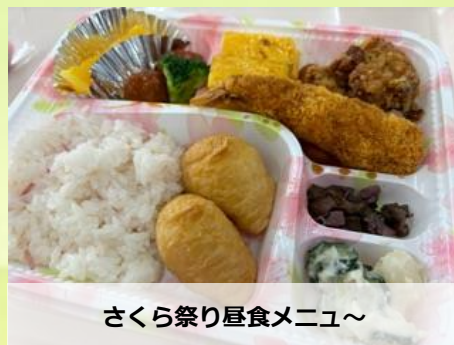
さくら祭り昼食メニュー～